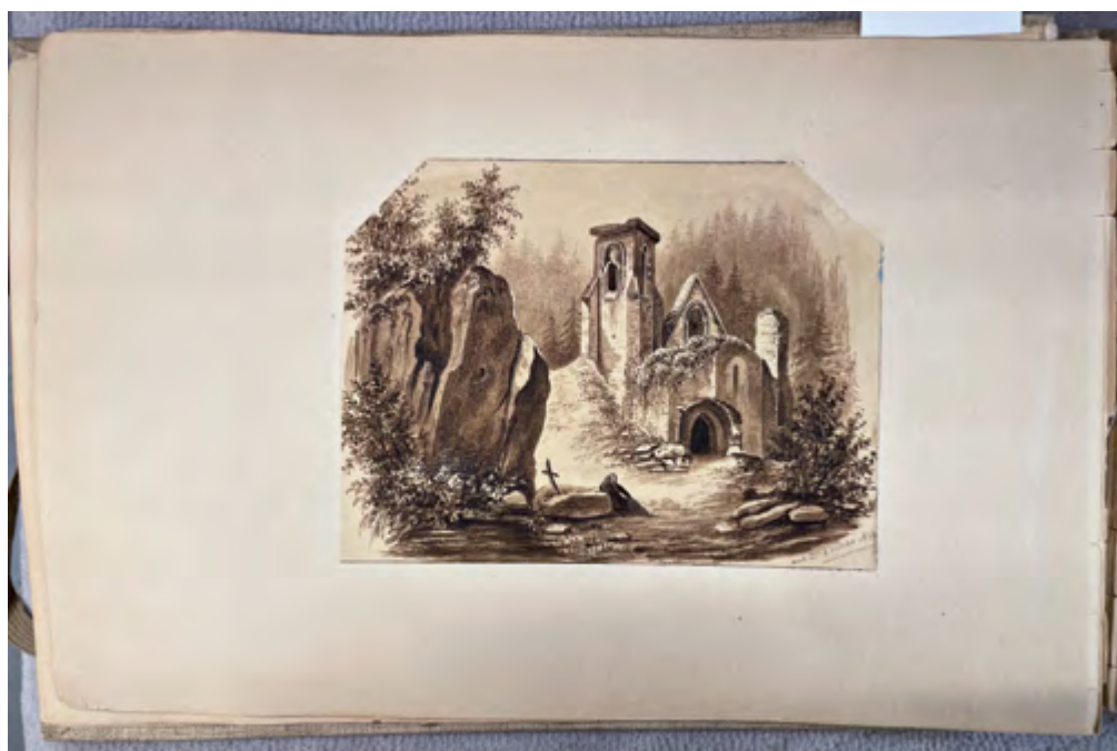
Fig. 6. George Sand. Château féérique . Feuillet n° 12. 2 mars 1830. Lavis. La Châtre. Musée George Sand et de La Vallée Noire. Inv. MLC 2022.1.1.