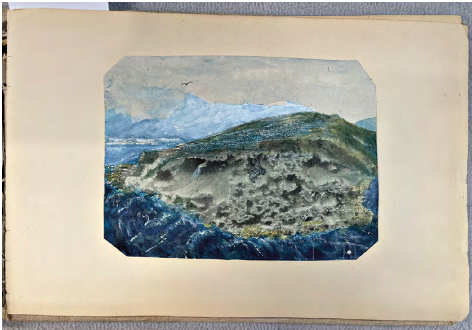
Fig. 1. George Sand. Crozant . Feuillet n° 7. Dessin au crayon. La Châtre. Musée George Sand et de La Vallée Noire. Inv. MLC 2022.1.1.